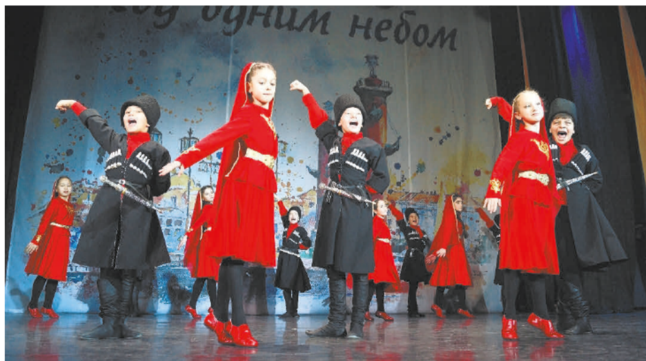
Детский ансамбль танцевальной студии «Нарт»

Шапка — чаще всего папаха — играла важную роль в жизни горцев. Она символизировала достоинство мужчины, и её было не принято снимать ни в помещении, ни даже за столом. Дополнял головной убор башлык — своеобразный капюшон с длинными полями-лопастями. Башлык надевали под шапку и носили на плечах, заткнув концы за пояс. Также их могли обматывать вокруг шеи, например во время езды верхом.