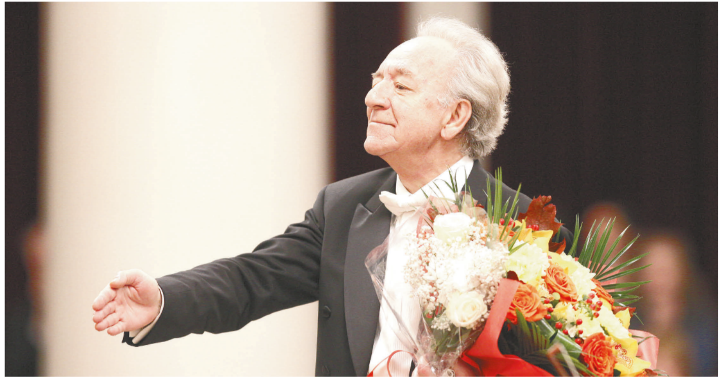
Народный артист СССР Юрий Хатуевич Темирканов

Всю красоту родной земли адыги вложили в женский костюм — традиционное платье «сай». Оно имело покроя черкески и надевалось поверх рубахи или кафтанчика. Шилось из бархата, плотного шёлка или сукна. Передняя часть представляла собой цельнокроеный клин по всей длине. Сай всегда украшался золотошвейным узором. Поверх сая девушки надевали серебряные или позолоченные пояса, украшенные традиционными орнаментами.